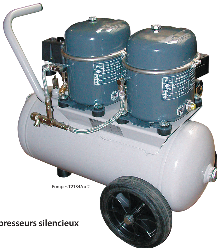
Pompes T2134A x 2