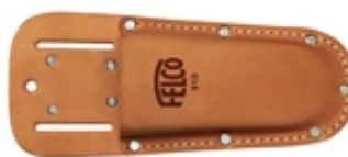
FELCO 910 Etui En cuir - Avec passant et pince