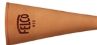
FELCO 912 Etui En cuir - Avec pince