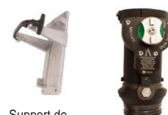
Support de Rangement Style 3448 FlowGuard