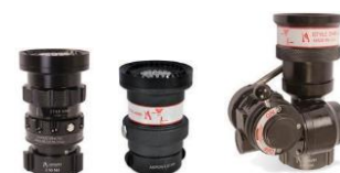
Tête Style 4446 Tête Style 4445 Tête Oscillante Style 5148