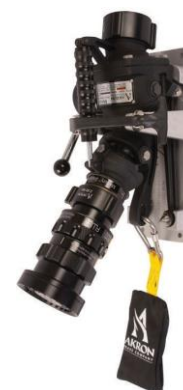
Exemple : support de rangement avec 3444 Quick Attack LE et tête 4446