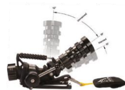
Angle minimal de 10°