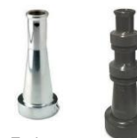
Embout Style 0489 Style 2420