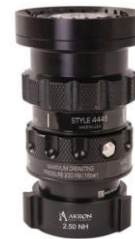
Tête Style 4446