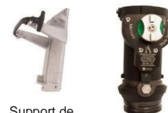
Support de Rangement Style 3448 FlowGuard